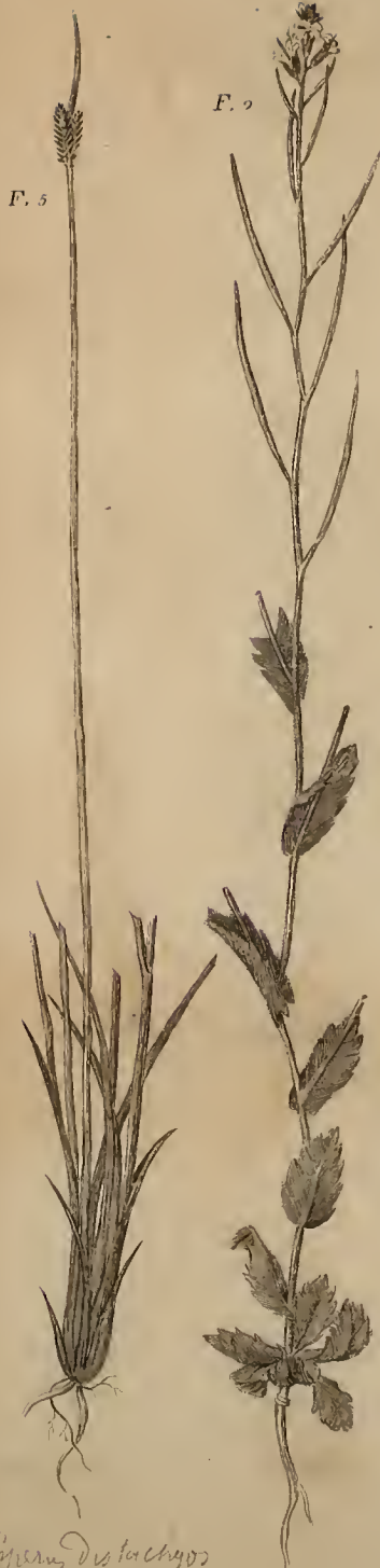
Cyperus distachyos p. 28