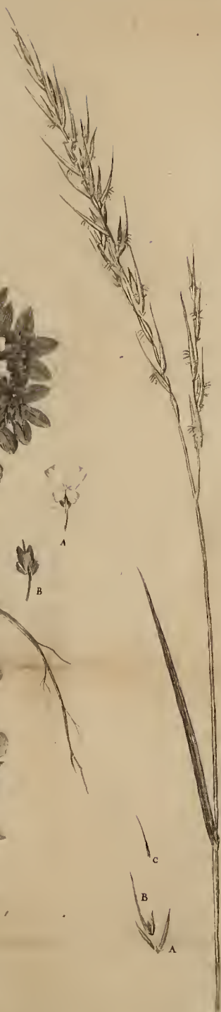
23. Stagnum L.