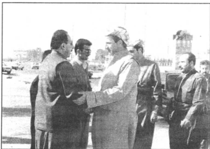
شهید سهریست له کاتی پیشوازیکردن له بهرین شیخ نهدهم بارزانی رێبهری حزب اللهی شۆرشگیرێ کورد- که سهردانی بارهگای یه کیتیمان YNDK ی کرد