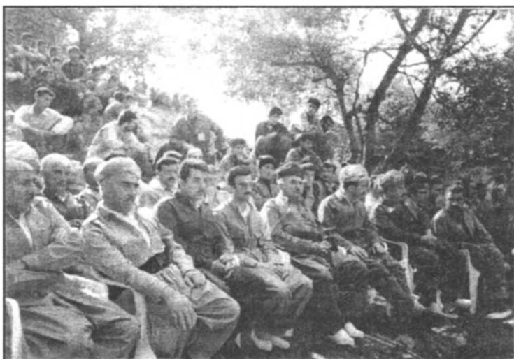
شهید سهره‌ست له‌یادی روژی روژنامه‌گه‌ری کوردی له‌هاوینه‌هه‌واری چوندییان