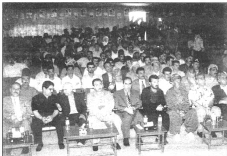
چله‌ی ماتمه‌ینی شه‌هید سه‌ریه‌ستا مه‌ جموود