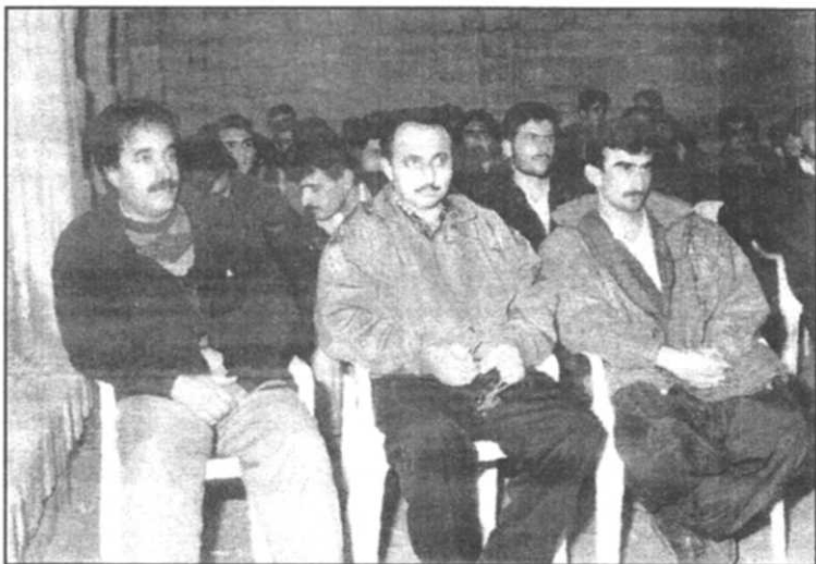
شهید سهریه‌ست له‌کۆنگره‌ی سینیه‌می YNDK دا (۱۹۹۹/۱/۱۲)