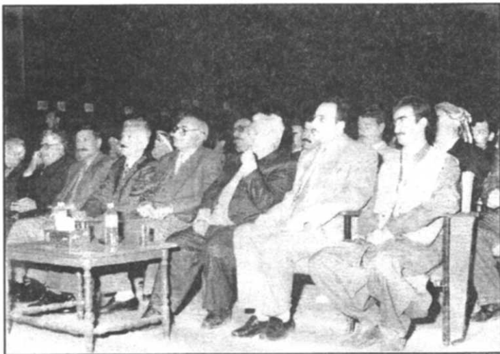
شهید سەربەست مەحموود لە چوارەم سانیادی دامەزراندنی YNDK دا ( ۱۹۹۹ / ۳ / ۲۵ )