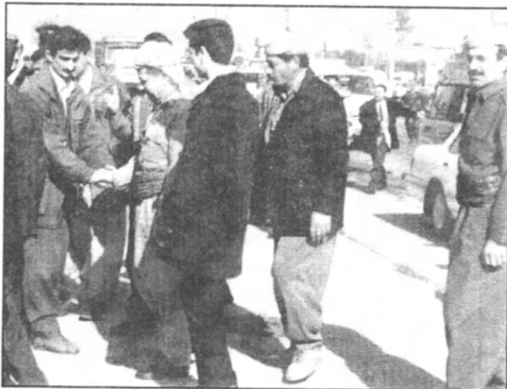
شهید سهریه‌ست مه‌حموود- له‌کاتی پیشوازیکردن له‌به‌پرز کاک مه‌سعود بارزانی ریبه‌ری بزاقی رزگار یخوازی نیشتمانی کوردستان دا که به‌پرزبان بۆ جه‌ژئانه سهردانی باره‌گای مه‌کته‌بی سیاسی یه‌کیتیمان YNDK ی کرد ( ۱۹۹۸/۲/۵ )