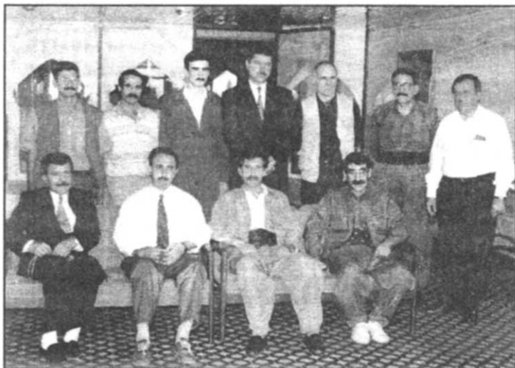
شهید سهره‌ست له‌گه‌ل نوینه‌ری پارتەکانی باکووری کوردستان