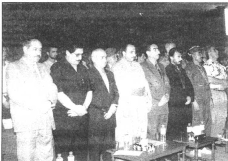
چله‌ی ماتمه‌ینی شه‌هید سه‌ریه‌ستا مه‌ جموود