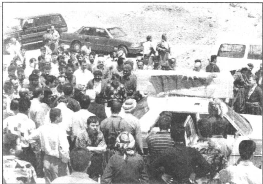
رئورده سمى بهرى كرده ئى تهرمى پىرۆزى شههيد سه ربه ستا مه حموود بو شارى سلیمانى