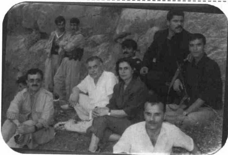
عهبدولای موهتهدی وسهلاحی موهتهدی برای و هاوهلانیان