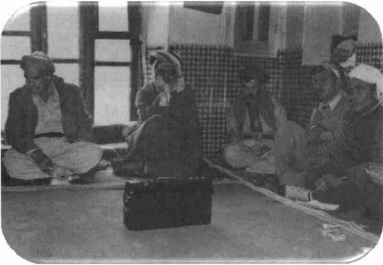
ساتى گويگرتن لەرادىيۆى دەنگى شۆرشى ئىران