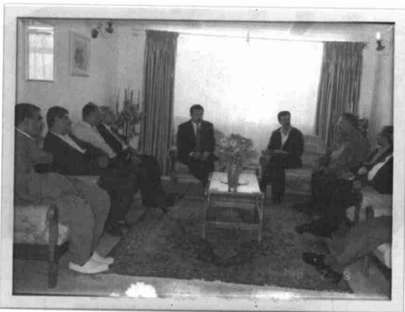
عهبدولای موهتهدی ومام جهلال و وهفدیکی (ی-ن-ک)