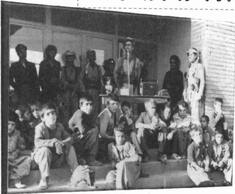
عهبدولای موهتهدی لهکاتی پيشکەشکردنی وتاردا