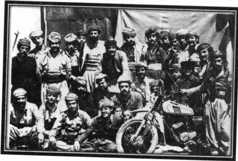
پۆلىك پىشمەرگەى كۆمەلە