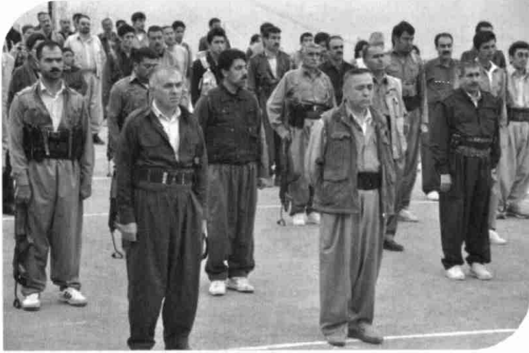
پۆلىك پيشمەرگه‌ى كۆمه‌له