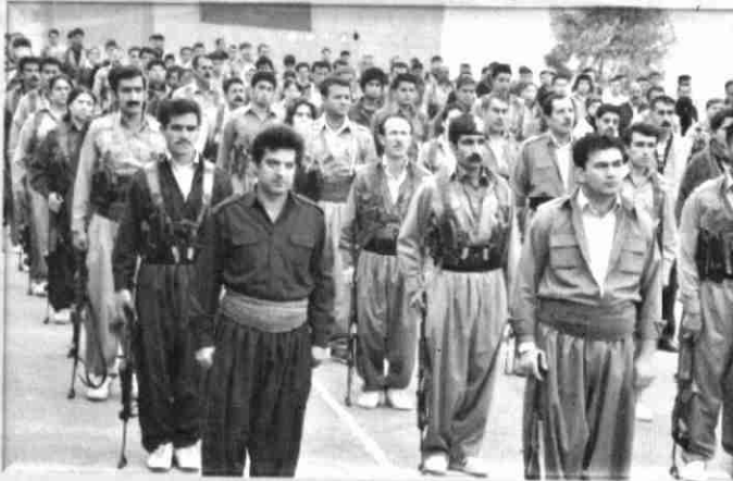
بۆلىك پېشمەرگەى كۆمەلە