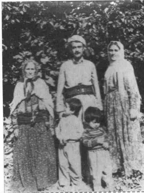
خانه وادهي عهبدولاي موهتهدي