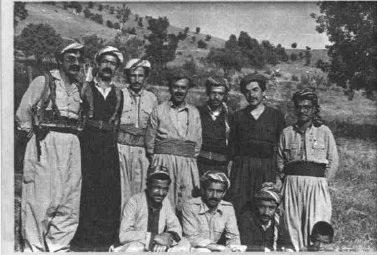
عهبدولاي موهتهدي وهاورپياني