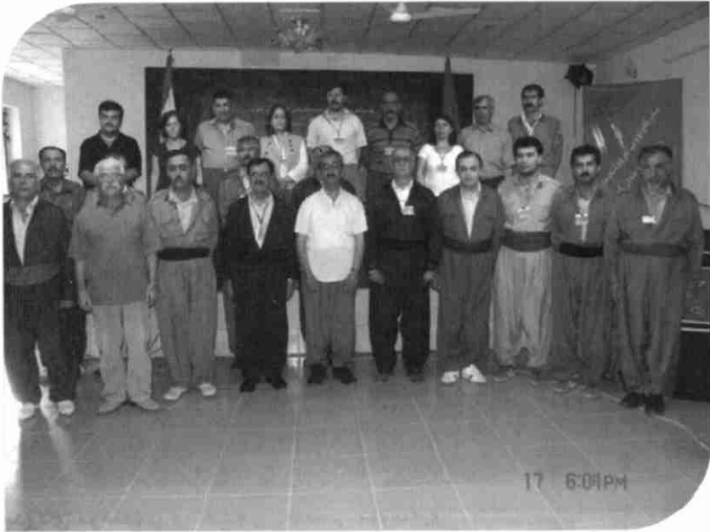
ئەندامانى كۆمىتەي ناوهندى كۆمەلە