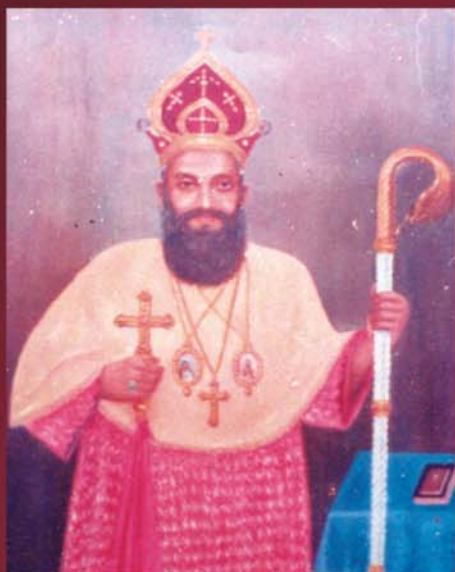
H.B. GEEVARGHESE MAR DIONYSIUS III (PUNNATHRA) MALANKARA METROPOLITAN MAY 19 ST. MARY'S CHERIYAPALLY, KOTTAYAM