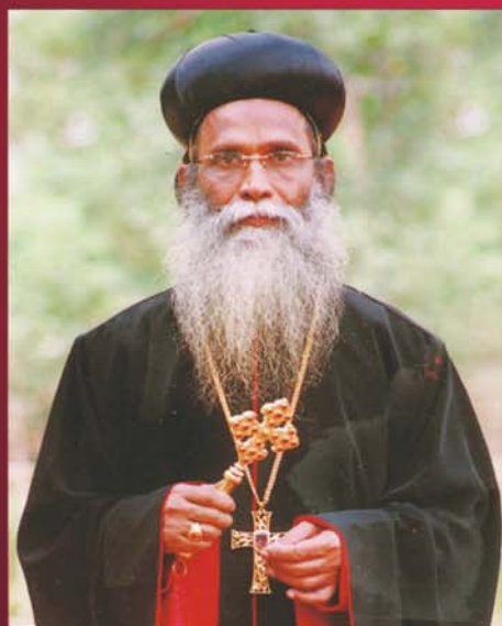
H.G. AUGEN MAR DIONYSIUS (2005-07) IDUKKI DIOCESE JUNE 6 VALLIKATTU DAYARA VAKATHANAM