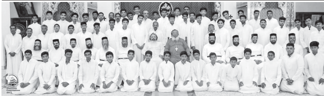
ചെങ്ങന്നൂർ ഭദ്രാസന കൺവൻഷനോടനുബന്ധിച്ച് നടന്ന ഇടയസവിധേ (ശുശ്രൂഷക സംഗമം)